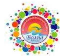
График реализации программы «На берегу лета»